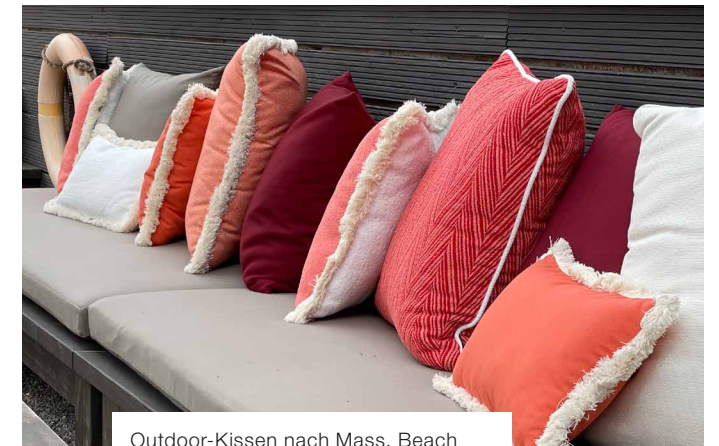
Outdoor-Kissen nach Mass, Beach Club Hermitage Luzern.