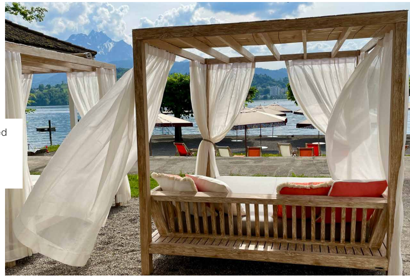
Makura Daybed Hermitage.